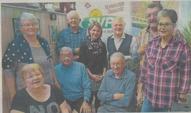
Neue Ortspartei: Die neun Personen haben die SVP Kleinlützel gegründet.